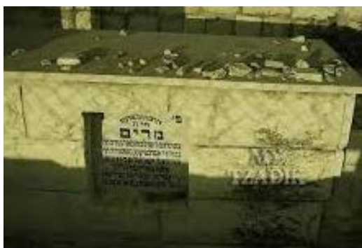
"לא התייצב למשפט". הרבי מבויאן וציון קברו

הגבאי נכנס לחדרו של הרבי בפנים מודאגות. הוא הניח את המכתב על שולחנו, ולא הוסיף מילה. "מי התובע?", שאל הרבי.