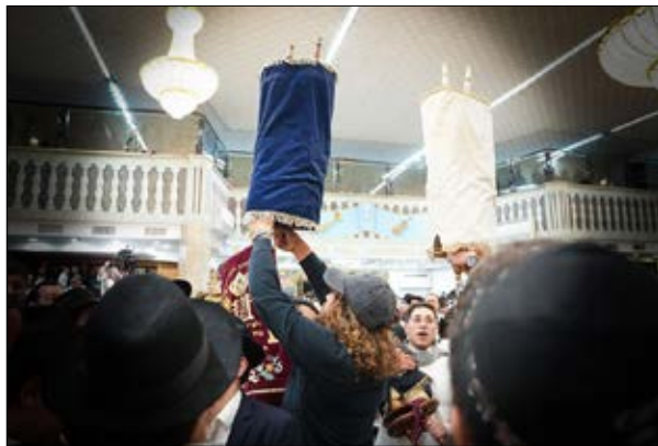
שמחת הנשמה. הקפות שניות בכפר חב"ד, אשתקד

החסידות מדברת הרבה על כוחה של השמחה להפוך מציאות שלילית לחיובית. היא מדגישה את ההכרח להימנע משקיעה בדכדוך ובעצב, אלא לשמוח ולרומם את הרוח, ובמיוחד בשמחת החגים ובשמחת התורה. שמחה פורצת גדרים, מבטלת גזירות ומעוררת שפע רב ממרומים.